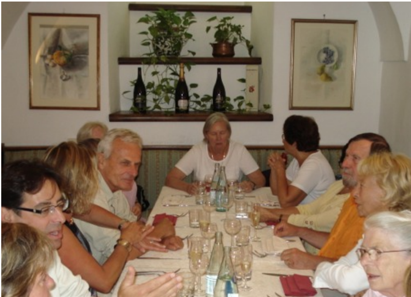
Un magnifique repas dans un superbe restaurant qui n'a pas aidé à se mettre en avance !

rêverie, même si de belles réalisations architecturales sortent du lot.